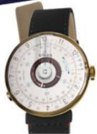
KLOKERS KLOK-08 Boîtier en acier, 39 mm. Mouvement à quartz Klokera à affichage par deux disques (un commun aux heures et aux minutes, et un pour les secondes) antihoraire.