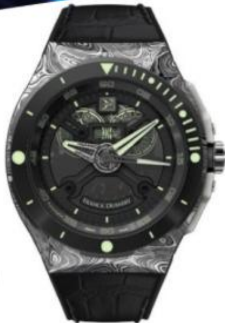
FRANCK DUBARRY Diver DIV-02 Damas Boîtier en acier, 43,5 mm. Mouvement Automatique Dubois-Dilgraz 14580.