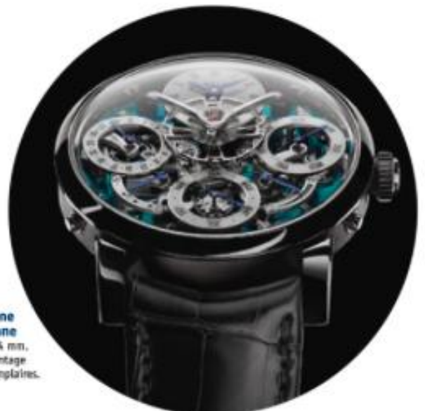
MB&F Legacy Machine Perpetual Titane Boîtier en titane, 44 mm. Mouvement à remontage manuel MB&F, 50 exemplaires.