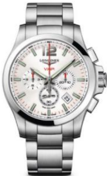
LONGINES Conquest V.H.P. Chronographe Boîtier en acier, 42 ou 44 mm. Mouvement à quartz haute précision Longines Conquest V.H.P.