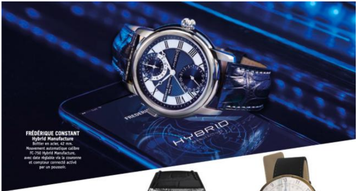
FRÉDÉRIQUE CONSTANT Hybrid Manufacture Boîtier en acier, 42 mm. Mouvement automatique calibre FC-750 Hybrid Manufacture, avec date réglable via la couronne et compteur connecté activé par un poussoir.